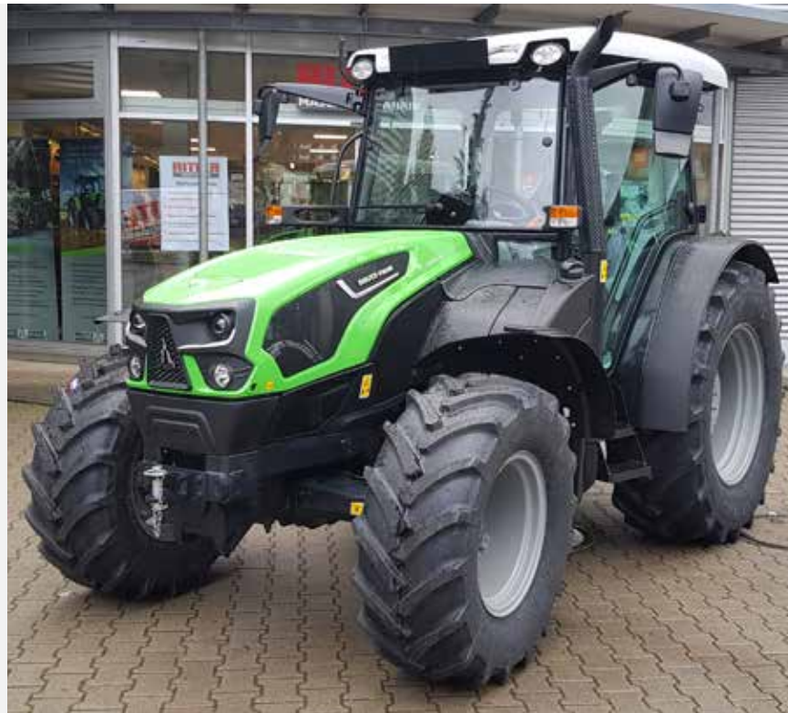
TRAKTOREN DER SERIE 5D

inkl. 19% MwSt. ab 68.425,- ANGEBOTS- PREIS*